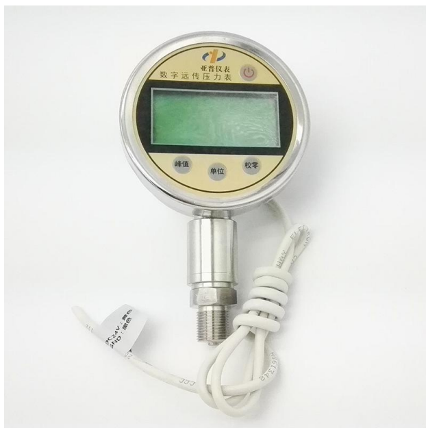
数字远传压力表 型号：YAPU.DDP.0501

YAPU.DDP.0501 数字远传压力表是一种单量程、低功耗、液晶数字显示的压力校验仪表。可作较高准确度校正标准器（表）对压力（差压）变送器、压力传感器、压力开关、普通（精密）压力表进行校准与检定。数显（绝压）压力表也可以用于在线压力测量。该产品广泛应用于冶金、石油、化工、电力、天然气、计量及科研等部门。