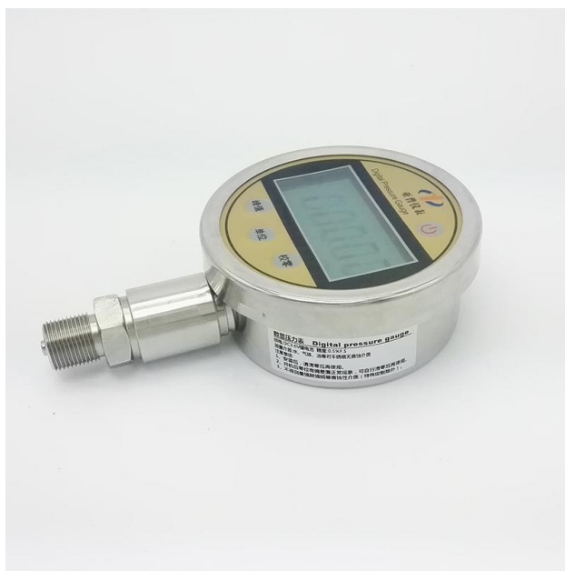
数显（绝压）压力表 型号：YAPU.DDP.0101

YAPU.DDP.0101 数显（绝压）压力表是一种单量程、低功耗、液晶数字显示的压力校验仪表。可作较高准确度校正标准器（表）对压力（差压）变送器、压力传感器、压力开关、普通（精密）压力表进行校准与检定。数显（绝压）压力表也可以用于在线压力测量。该产品广泛应用于冶金、石油、化工、电力、天然气、计量及科研等部门。